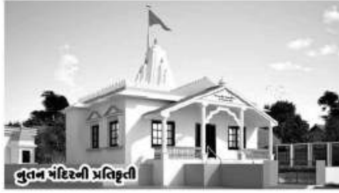
નુતન મંદિરની પ્રતિષ્ઠા

શ્રી લાકડીયા જખખૌતેરા, શ્રી વિશલ માતા મંદિરના નવનિર્માણ નિમિત્તે પહેડી અને શ્રી વિશલમાતા અને શ્રી જખખ દાદાની પ્રતિમાઓના ચડાવા રવિવાર, તા. ૧૬-૧૧-૨૦૧૭ ગામ લાકડીયા હિરાણીના વાસમાં શ્રી જખખૌતેરા અને શ્રી વિશલમાતા મંદિર (સ્થાન)માં નમતા ગાલા નુખના હિરાણી-રાણાણી-પૂંજાણી-ખીરાણી-ઝાઝ-ઝાલાણી-કચ્છા અને સર્વ ગાલા ભાવિકો જોગ